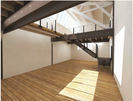
Vue en perspective sur le percement