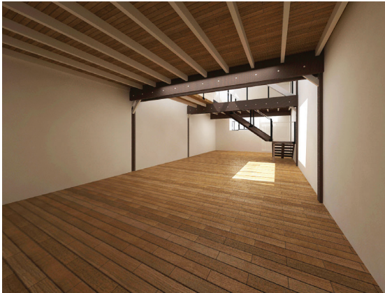
Vue en perspective sur l'entrée