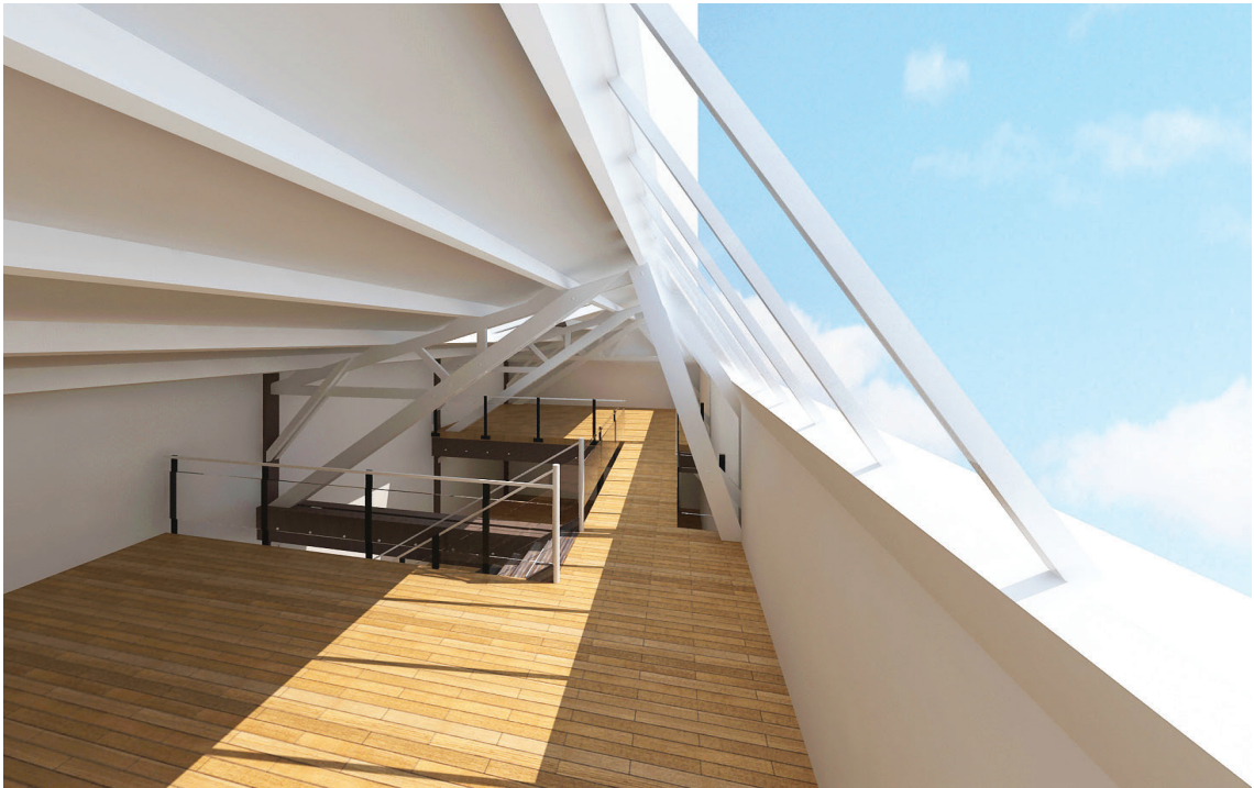
Vue en perspective depuis le niveau 1