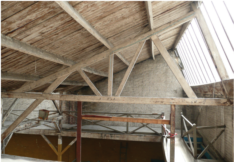
Photo de la charpente existante

Une ancienne usine de fabrication de tissus sur deux niveaux, laissée à l'abandon dans un état critique, avec l'ossature en bois et la toiture en Shed. L'objectif est de rénover le bâtiment en faisant des Lofts prenant en compte les trames des éléments structuraux.