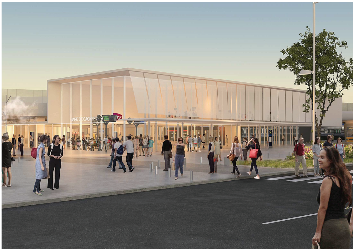
Vue depuis l'avenue de la gare