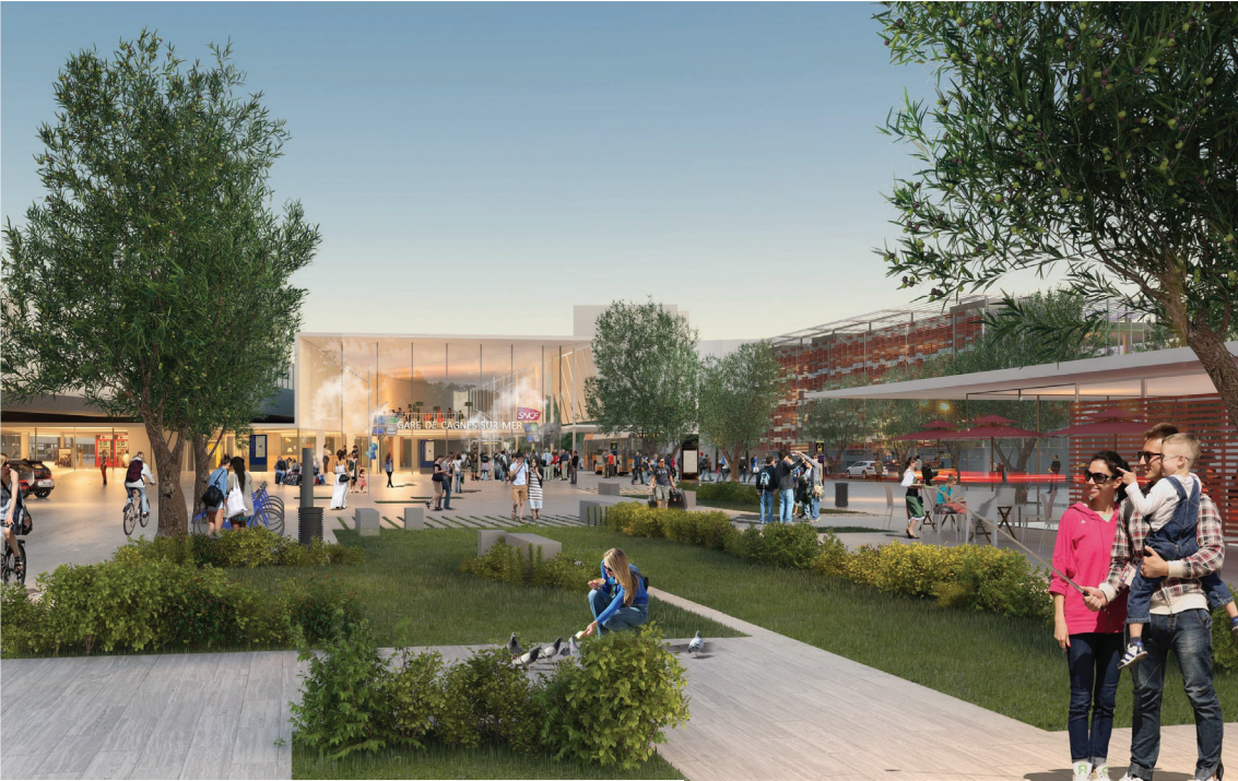
Vue en perspective de la gare depuis le parvis