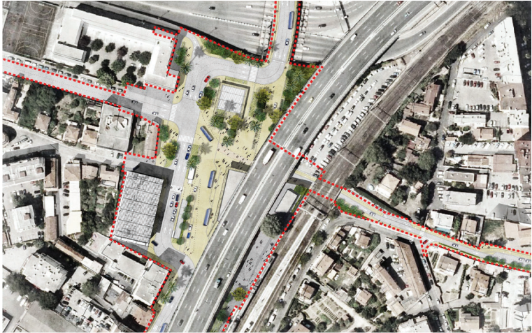
Plan masse du réaménagement de la gare et du parvis

La construction d'un nouveau bâtiment voyageur et d'une zone de réaménagement urbain est proposée afin de répondre au besoin croissant de flux voyageur et donner une nouvelle identité à la gare existante et son contexte urbain. Un parvis, un kiosque, une gare routière et un parking relais sont également prévus dans ce réaménagement.